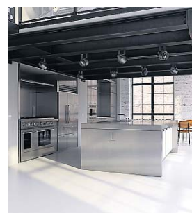
Wonen&Co (twee woonruimtes die een stylisten-team speciaal voor ons inrichten - volgende week is hier alles over te lezen in onze beurspecial) legt VDA een vloer. "In de Royal Living combineren ze de gietvloer met een houten vloer en luxe, stoere meubels. Onze vloer past goed in het sfeertje dat de stylisten daar willen neerzetten." Er kan veel met een gietvloer. Al zal de gemid-